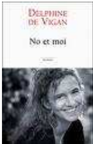
No et moi de Delphine de Vigan