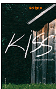
Kiss de Jacqueline Wilson