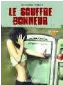
Le souffre bonheur de Christophe Renault

Cette année quatre livres sont en concurrence abordant le thème de l'altérité, l'identité.